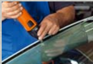
FEIN Profi-Set Kfz-Werkstatt S. 12–13

Mit dem Profi-Set Kfz-Werkstatt lassen sich Front-, Heck- und Seitenscheiben austrennen. Darüber hinaus enthält es weiteres Zubehör zum Sägen und Schaben von Kunststoff und Metall.