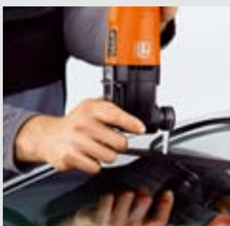
Gekapselte Windschutzscheiben und anvulkanisierte Rahmen, auch mit Aluminium-Verstärkung, lassen sich mit dem L-Messer in einem Arbeitsgang austrennen. Empfohlene Geschwindigkeit: Stufe 3 – 4.