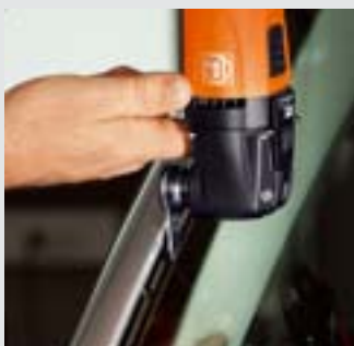
Mit dem L-Messer haben Sie bei gleicher Geschwindigkeit eine um 40% höhere Schnittleistung als bei einem vergleichbaren U-Messer. Beschädigungen an der Karosserie sind nahezu ausgeschlossen. Empfohlene Geschwindigkeit: Stufe 3 – 4.