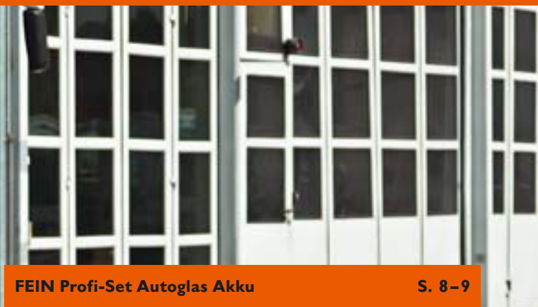
FEIN Profi-Set Autoglas Akku S. 8–9