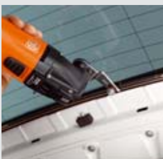
Mit dem Schneidmesser Form 143 und verstellbarer Anschlagrolle lassen sich Seiten- und Heckscheiben einfach und schnell von innen ausglasen. Empfohlene Geschwindigkeit: max. Stufe 3.