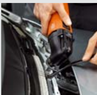
Mit dem Schabmesser entfernen Sie Restkleber ohne Kraftaufwand sauber und schnell. Empfohlene Geschwindigkeit: Stufe 2 – 3.