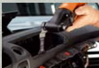
FEIN Zubehör für Spezialanwendungen S. 16–17

Mit dem erweiterten Zubehörprogramm für den FEIN SUPERCUT AUTOMOTIVE bewältigen Sie Spezialanwendungen einmalig gut und schnell: Aufgaben, die normalerweise viel Zeit in Anspruch nehmen, erledigen Sie damit ohne großen Aufwand in höchster Qualität.