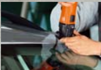
FEIN Profi-Set Autoglas S. 10–11

Das Profi-Set Autoglas ist mit seinen Schneidmessern darauf spezialisiert, die Frontscheiben der meisten Pkw schnell und sicher auszutrennen.