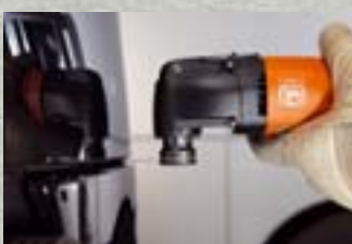
FEIN Profi-Set Cargo S. 14–15

Das Profi-Set Cargo mit ganz speziellen Schneidmessern ist die maßgeschneiderte Lösung für die großflächigen Scheiben in Lkw, Bussen sowie Sonder- und Schienenfahrzeugen.